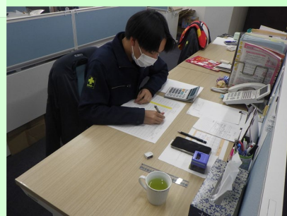
▲書類を作成しているところ